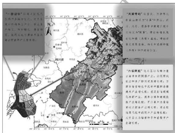
图2 达州市中药材产业发展整体规划图

发展空间布局(见图2),将中药材产业培育成我市特色优势产业,成为我市脱贫攻坚和乡村振兴的重要支柱产业。